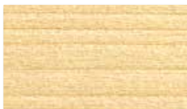
bezfarebná & báza P0000

Vzorkovník aktuálnych odtieňov Primalex Lazúra tenkovrstvá: